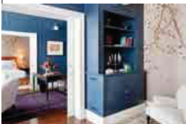
VIDAGO PALACE (OPORTO)

biente del Royal Riviera , en Saint Jean Cap Ferrat (Costa Azul), "por su encanto y su discreto glamour ". ● Entre sus últimas reaperturas figura la del Vidago Palace de Oporto, "me fascina su ambiente de cuento de hadas y su spa", concluye.