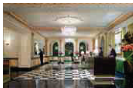
TAJ PIERRE (NUEVA YORK)