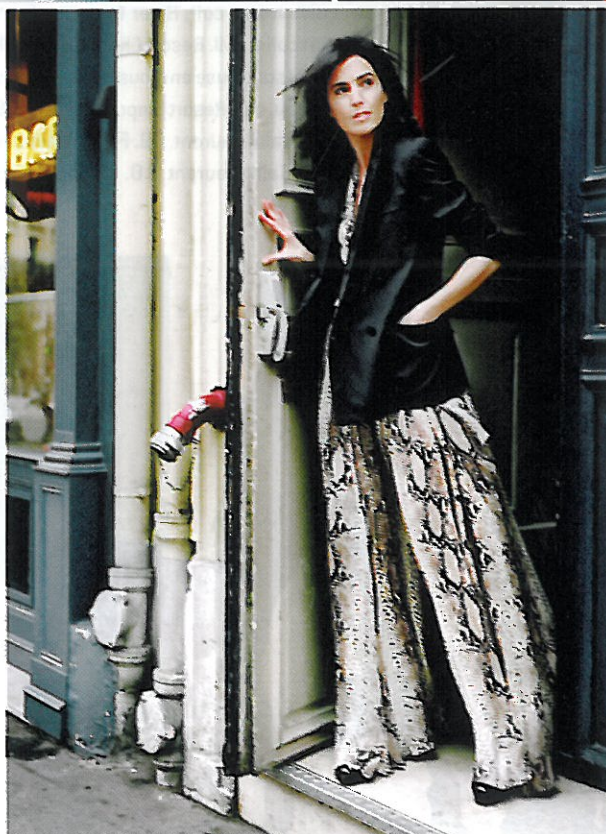
Ci-dessus, option cuir, veste en cuir nappa, collection Leather Icons, Loewe, sur robe rouge en laine stretch, Lanvin. Bracelet main argent et émail, Delfina Delletrez, et sac "Amazona" en cuir et peau, Loewe. Ci-contre, jouer le décalage, veste de smoking en laine sur combinaison pantalon en soie imprimée serpent, chaussures vernies, l'ensemble Lanvin.

Photos réalisées à l'hôtel Jules. 49-51, rue Lafayette, 75009. Tél. 01 42 85 05 44 et hoteljules.com